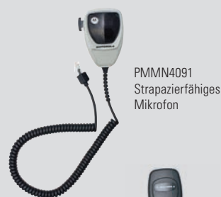
PMMN4091 Strapazierfähiges Mikrofon