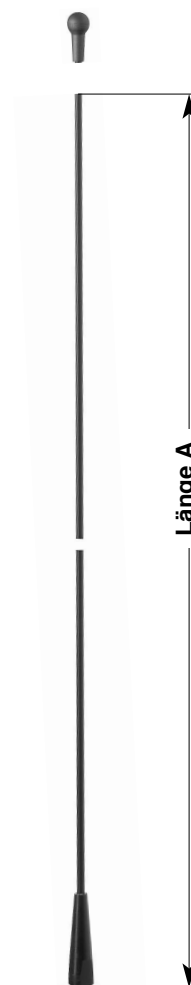
Strahler 506 10007