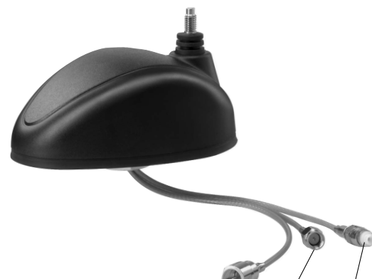
Antennenfuß 506 10004