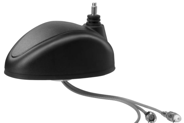
Antenna foot 506 10004